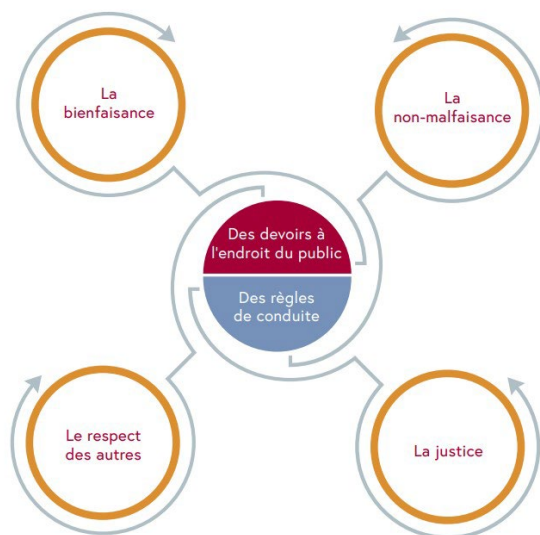
Figure 2 : Infographie tirée du Code de déontologie